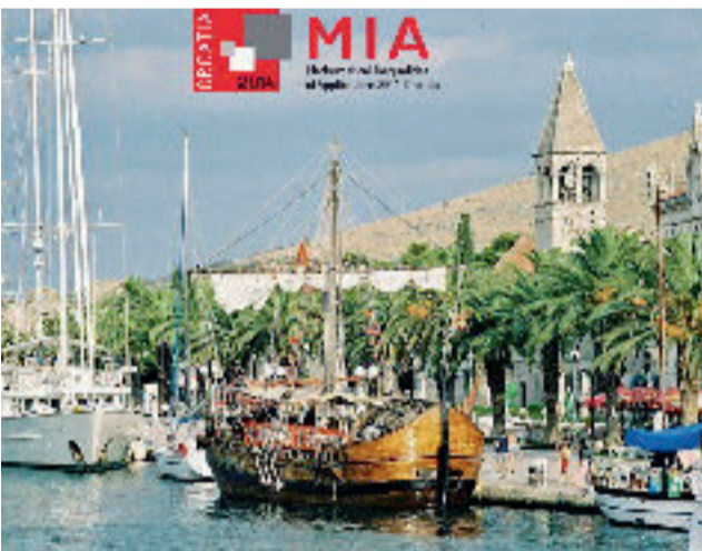
MIA matematička konferencija 2014

Pokrovitelj konferencije MIA 2014 je Razred za matematičke, fizičke i kemijske znanosti Hrvatske akademije znanosti i umjetnosti, čime je organizatorima iskazana izuzetna čast te potvrđen značaj ovog znanstvenog skupa.