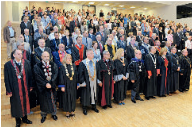
Rektori i delegacije domaćih i stranih sveučilišta